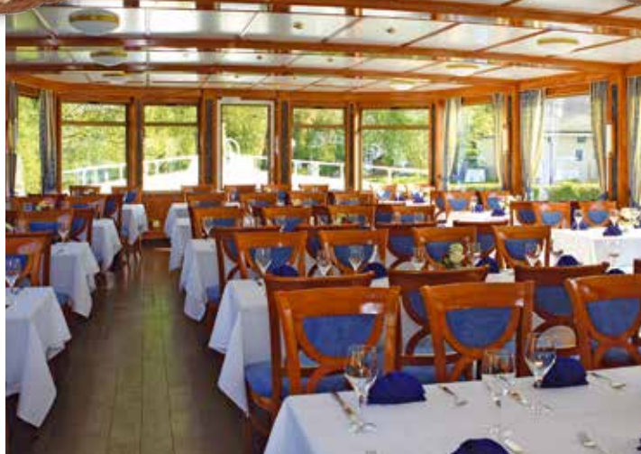
Großzügiger Salon mit viel Raum für kulinarische Erlebnisse.