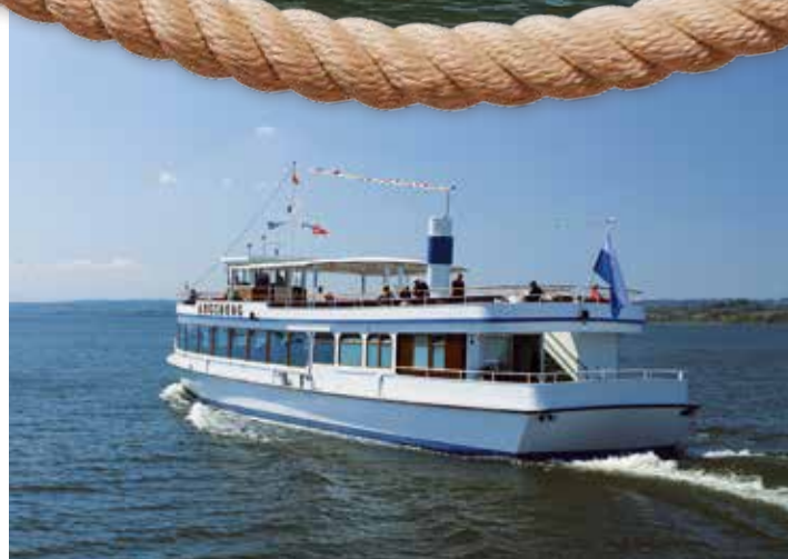
Schiffahrt in die Sonne.