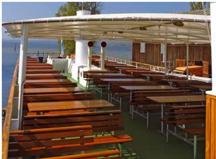
Schöne Aussicht vom Sonnendeck.