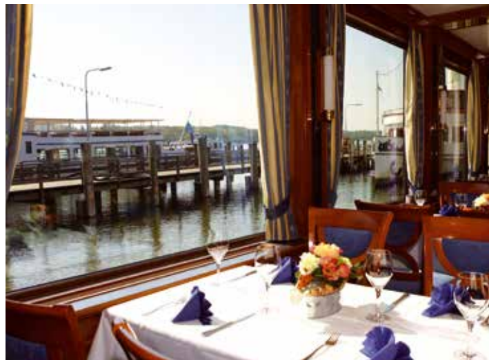
Stilvoller Rahmen für besondere Anlässe.