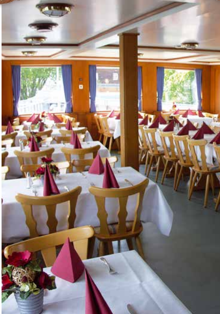
Der rustikale Hauptdecksalon.