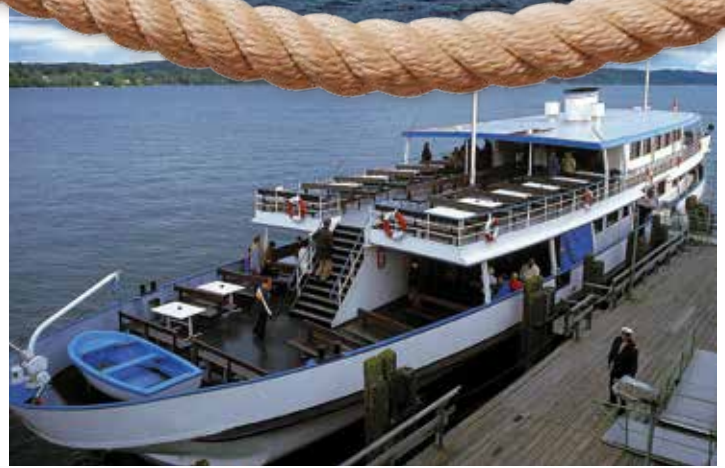
Schöne Aussicht vom geräumigen Sonnendeck.