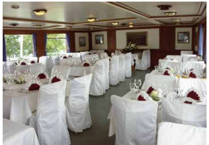
Besondere Wünsche erfüllen wir gerne.