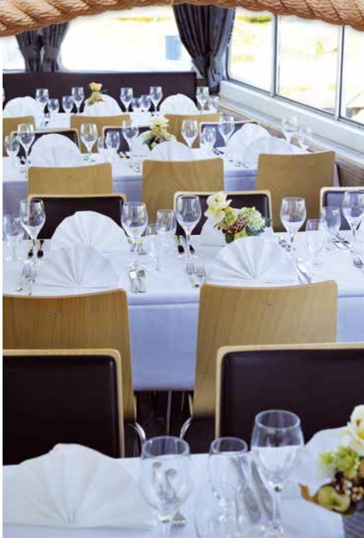
Großzügiger Salon mit viel Raum für stilvolle Feste.