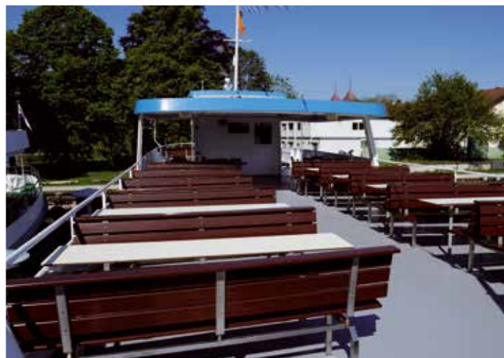
Freie Sicht am Sonnendeck.