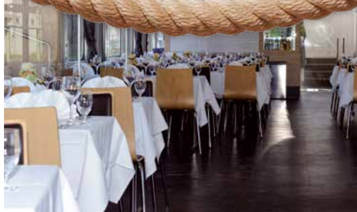
Eleganter und moderner Salon.