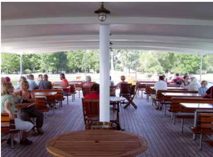
Überdachtes Freideck mit viel Platz zum Entspannen.