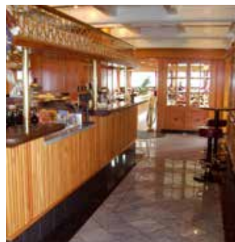
Mitschiffs: die Bar.