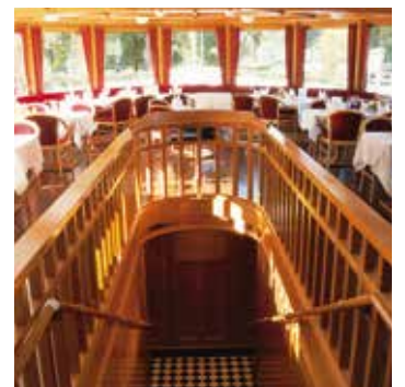
Der komfortable Bugsalon.