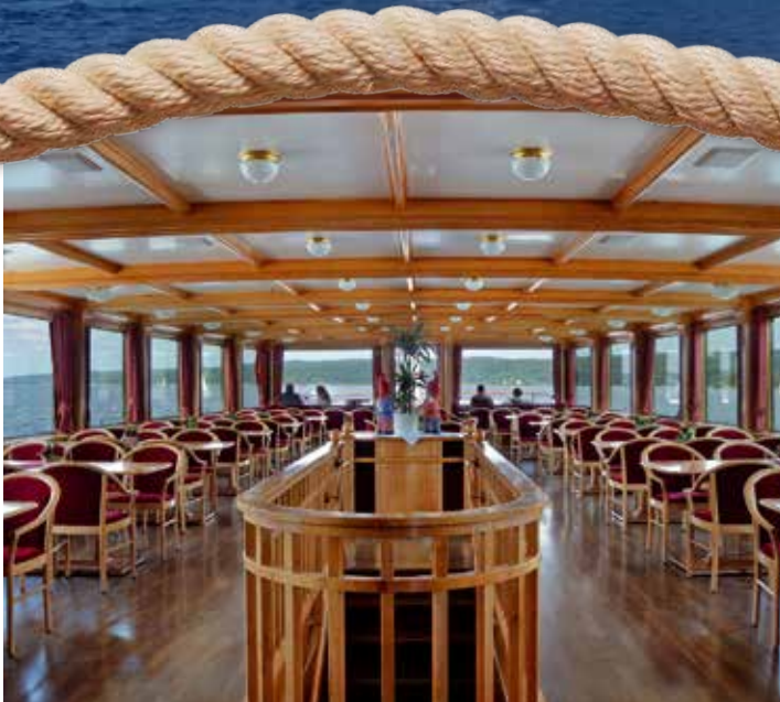
Stilvolles Ambiente im Hecksalon.