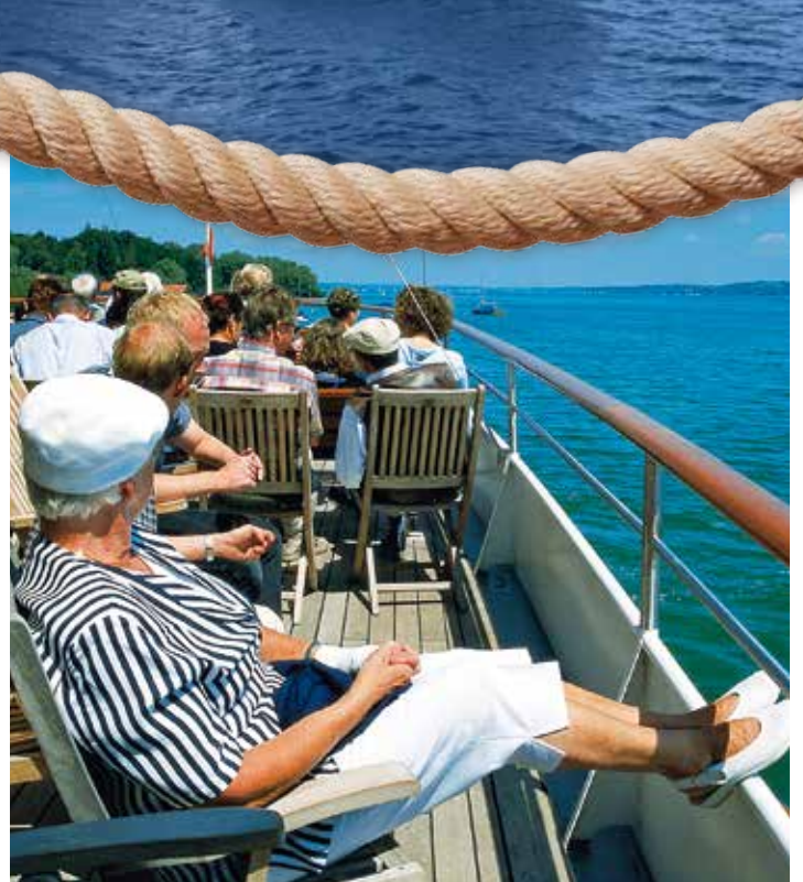
Wasser, Luft und Sonne genießen.