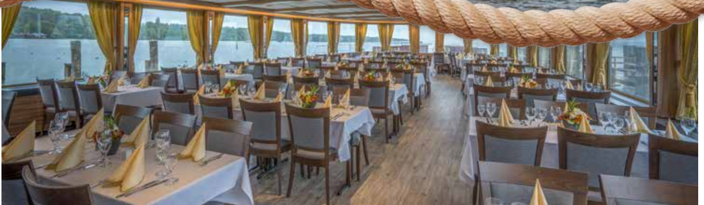
Der wunderschöne, lichtdurchflutete Salon.