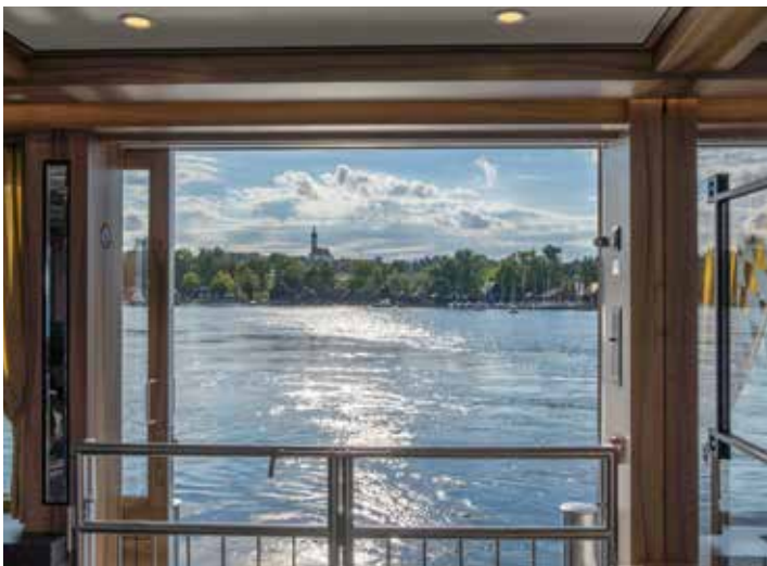
Herrlicher Ausblick auf den Ammersee und das Pilgerkircherl St. Jakob.