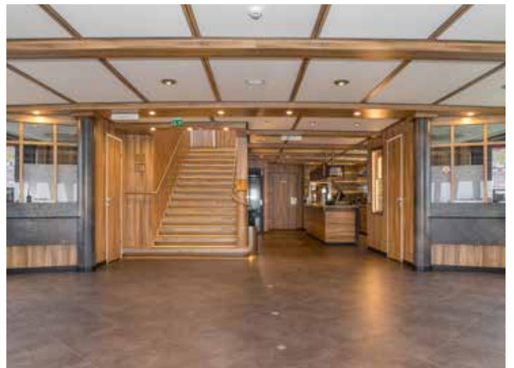
Das MS UTTING bietet viel Platz für Tanz oder Buffet.