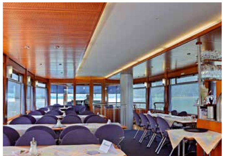
Der elegante Oberdecksalon.