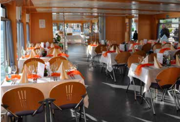
Stilvoller Rahmen für feierliche Anlässe.