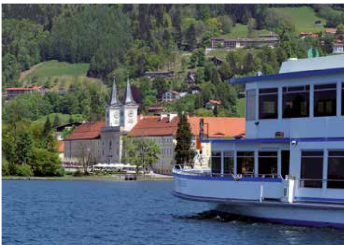
Unvergessliche Momente an Bord.