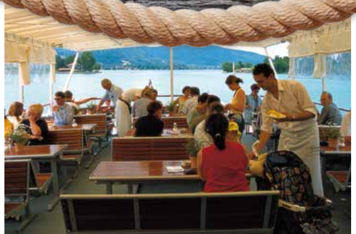
Herrliche Aussicht auf dem überdachten Freideck.