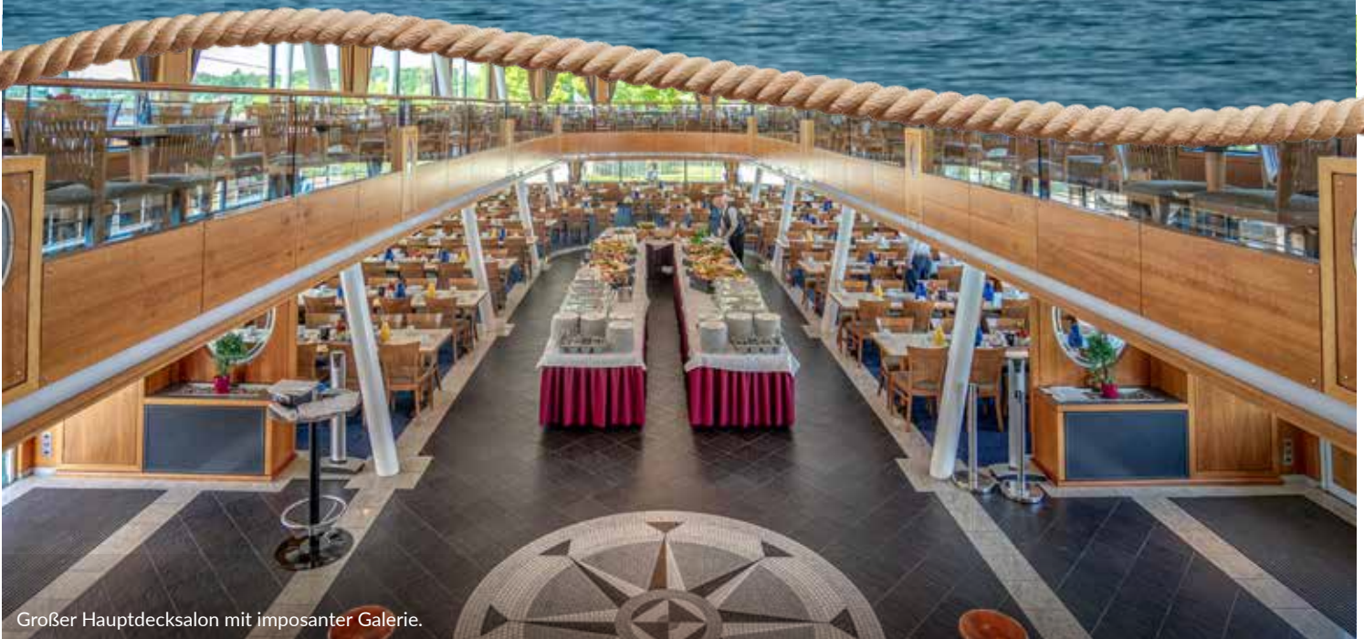
Großer Hauptdecksalon mit imposanter Galerie.