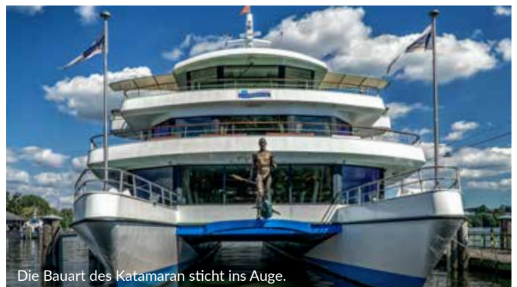
Die Bauart des Katamaran sticht ins Auge.