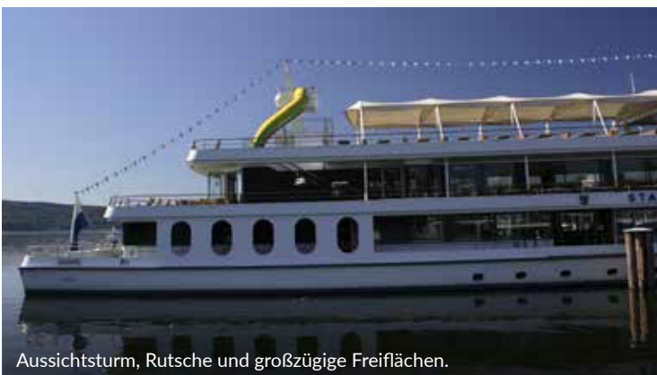
Aussichtsturm, Rutsche und großzügige Freiflächen.